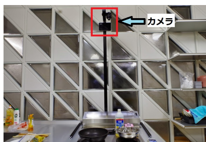
図 1. 調理時の動画撮影の様子。自立型フレームに取り付けたカメラで上部から撮影する。

レシピを参考にして調理をしたものの、上手くいかなかったことは多くの人が経験しているだろう。こうしたケースでは、多くの人々は、料理本やクックパッド 1 のような文字や画像のみのレシピを用いている。しかし、料理を普段やらない初心者が文字や画像のみのレシピを参考にしてその通りに料理を再現することは難しい。なぜならば、こうした既存のレシピは、暗黙的に一定の料理スキルを前提としているからである。すなわち、材料と手順のみが規定されており、詳細なタイミングは個人の経験に任されていることが多い。初心者にはこのタイミングが分からないため、調理を再現できない可能性が高まってしまふ。そこで、我々は、初心者が料理を再現するには、実際に調理している様子を動画で撮影した「動画レシピ」が有効であると考えた。本研究では、短時間で効率的に閲覧可能な「高速動画レシピ」を手軽に生成するシステム「CookSum」を提案する。